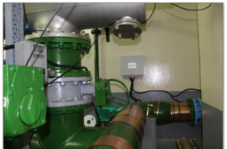
Vulcan S500 a été installé dans la salle des pompes